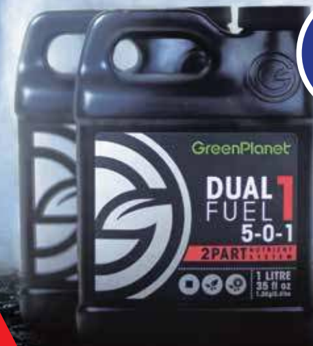
TABLEAU DE NUTRITION